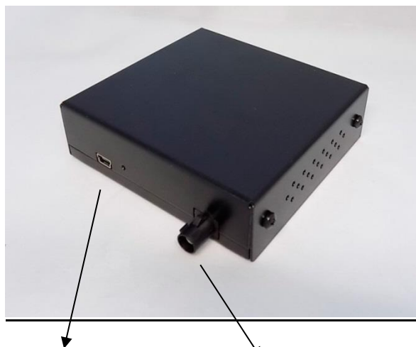
(a) USB til softwareoppdatering